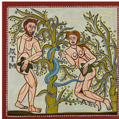
Fragmento de pintura mural da ermita de Vera Cruz de Madurelose (Segóvia).

Identificar as causas da desordem e os meios para o restabelecimento de uma sexualidade integrada na pessoa.