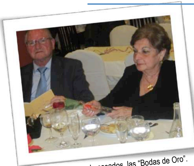
Celebrando 50 años de casados, las "Bodas de Oro".

Cuando los novios se casan, como ya hemos visto, se dicen: "Te quiero a ti, en la en las alegrías y en las penas, en la salud y en la enfermedad, todos los días de mi VIDA". ¡Qué maravilla!