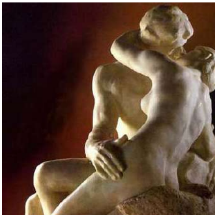
Detalle de la escultura de Rodin "El beso".

Quando ENTREGAS EL CUERPO también ENTREGAS TU FERTILIDAD: